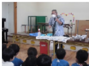
みんなの前に大きなお魚の登場！